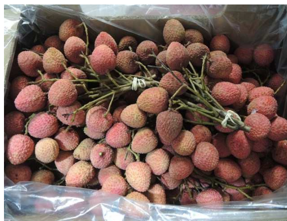
Litchis bouquet du Brésil par avion

Cette semaine se caractérise par un changement profond de tendance pour le marché du litchi. La baisse tarifaire, traditionnelle au lendemain des fêtes de fin d'année, s'accroît nettement. La légère reprise espérée en deuxième semaine de janvier ne s'est pas produite, et le marché s'enfonce dans une course contre la montre pour écouler les stocks encore disponibles en litchis de Madagascar. Le produit sort de consommation, tant sur les marchés extérieurs qu'au niveau national. La fin de campagne s'annonce difficile pour les produits malgaches vieillissants.